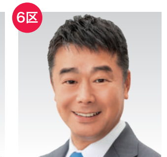
あずましい国づくりへ！ 東くによし