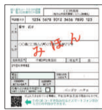
交付申請書のQRコード