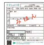
交付申請書のQRコード