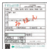
交付申請書の申請書ID