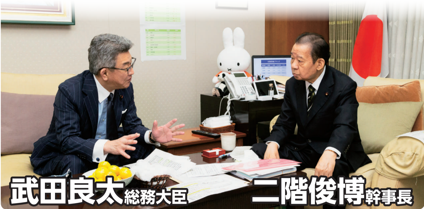
武田良太 総務大臣

さらに、行政や民間の手続きで使っても、税や年金などの情報はカードに記録されず、情報が税務当局などに伝達されることもありません。